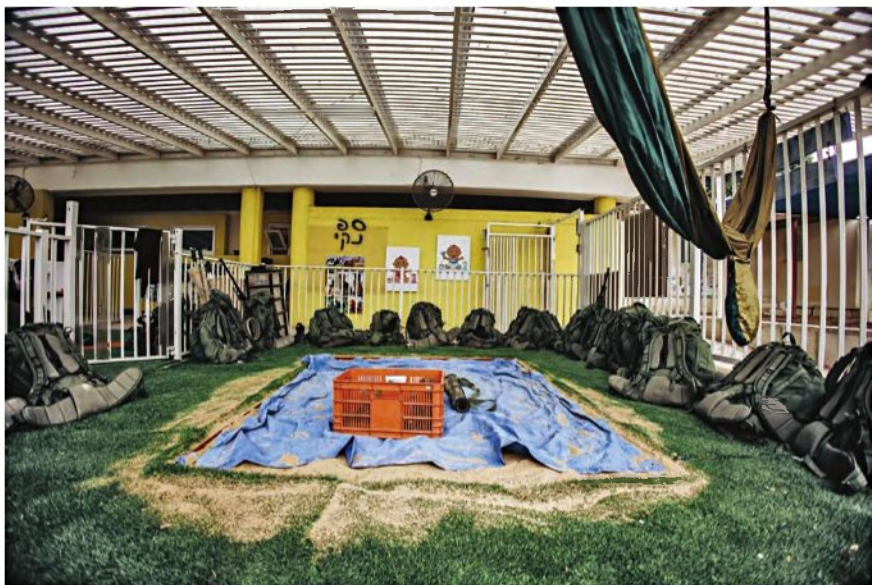
"הכל מתערבב שם בתמונה הזו". מתוך התערוכה