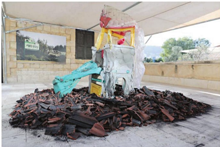
"היה חשוב לי לספר את הסיפור כמו שהרגשתי אותו ולהגישו לקהל". מגלשה שנמסה מהחום של התופת בקיבוץ בארי