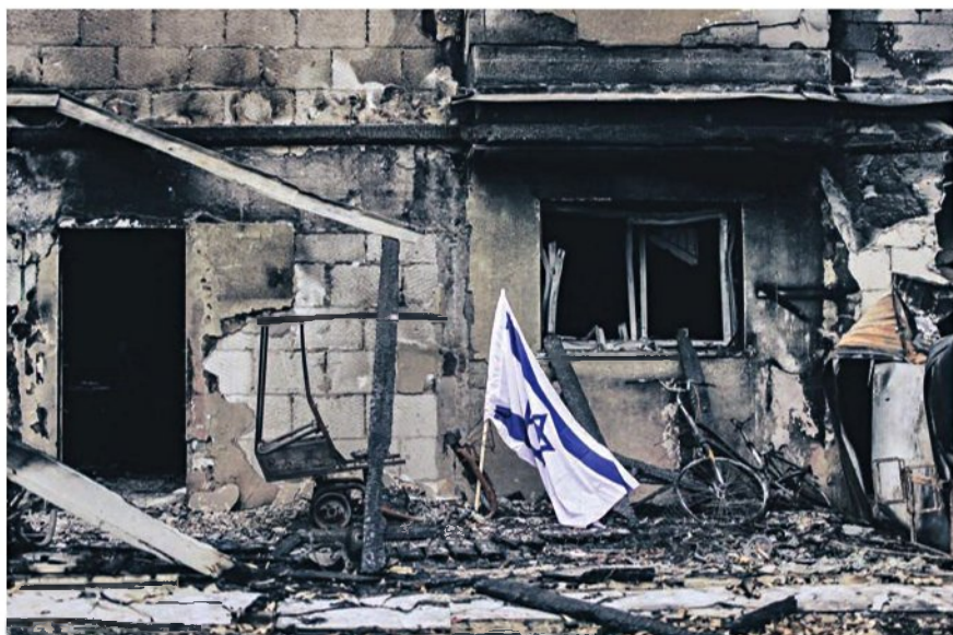
"אתה מצלם ממ"דים של משפחות ומתחיל לשמוע קולות, להכיר את הסיפורים ששמעת". צילום של בית שרוף בבארי

שנות. נחשפתי לסיפורים, לעבודת הקודש של זק"א ולעבודת הקודש של צה"ל.